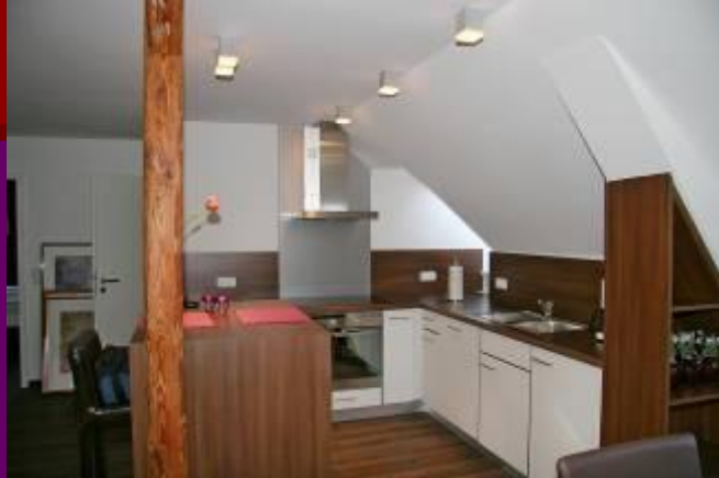
Küche mit Geschirrspüler, Induktions- Kochfeld und Kühlschrank.