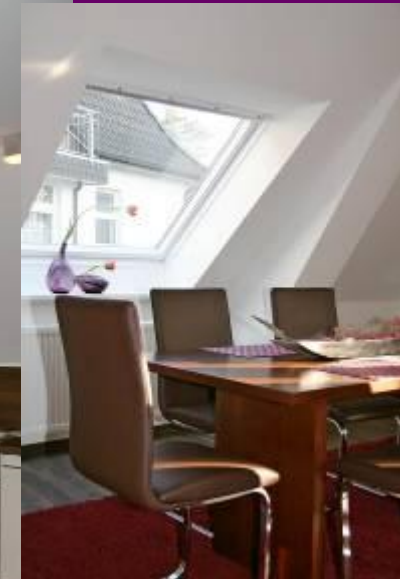
Essplatz für 6 Personen