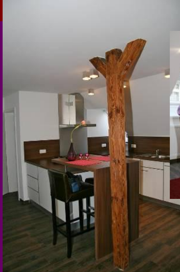
Frühstückstresen an der Küche