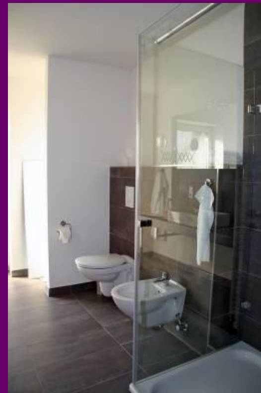
luxuriöses Duschbad mit Bidet, Toilette und Dusche